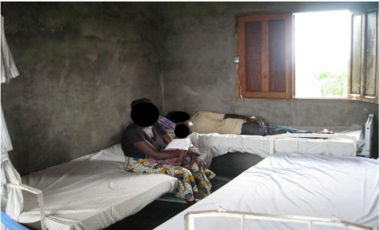
Salle des soins et d'hospitalisation du Centre de santé Emmanuel

Les femmes enceintes éprouvent d'énormes difficultés pour s'accoucher. Elles sont obligées d'aller dans les maternités avoisinantes situées à plus ou moins 4 kilomètre de la Cité. Il y a quelques véhicules qui font du transport en commun mais ils n'arrivent pas à la Cité de l'Espoir. Ils s'arrêtent à un petit marché situé à plus ou moins 3 km de la Cité et il faut mettre au moins deux heures à attendre avant de trouver un véhicule.