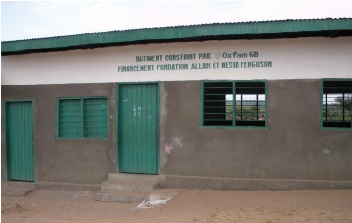
Bâtiment de l'EP Bono construit par Oxfam