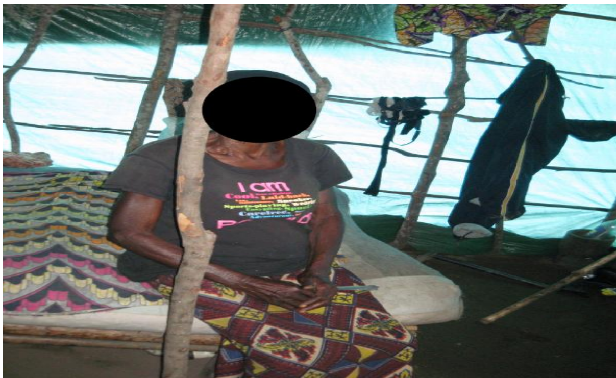
L'aspect intérieur d'une tente maison