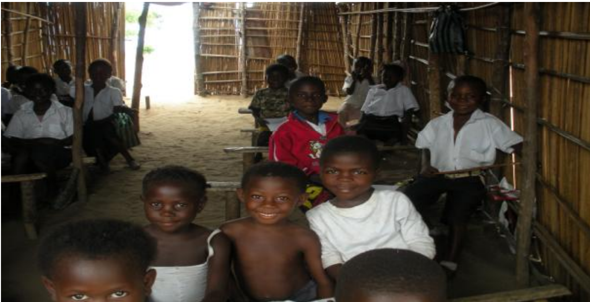
Salle de classe de la deuxième primaire du Complexe Scolaire la Providence

Il faudra signaler que jusqu'à ce jour, cette école fonctionne sans Arrêté ministériel d'agrément en dépit des démarches effectuées par leurs responsables auprès du Ministère de l'Enseignement primaire, secondaire et professionnel 16 . Les responsables de l'école ont rapporté à l'ASADHO avoir envoyé plusieurs courriers aux autorités gouvernementales compétentes pour qu'une solution soit trouvée à ce problème, mais qu'elles n'ont pas reçu de suite satisfaisante jusqu'à ce jour.