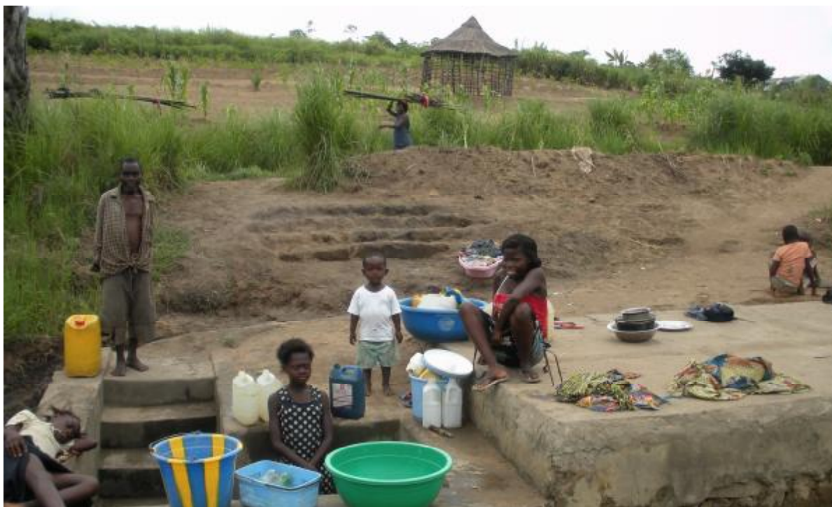
Un puits d'eau où les habitants s'approvisionnent