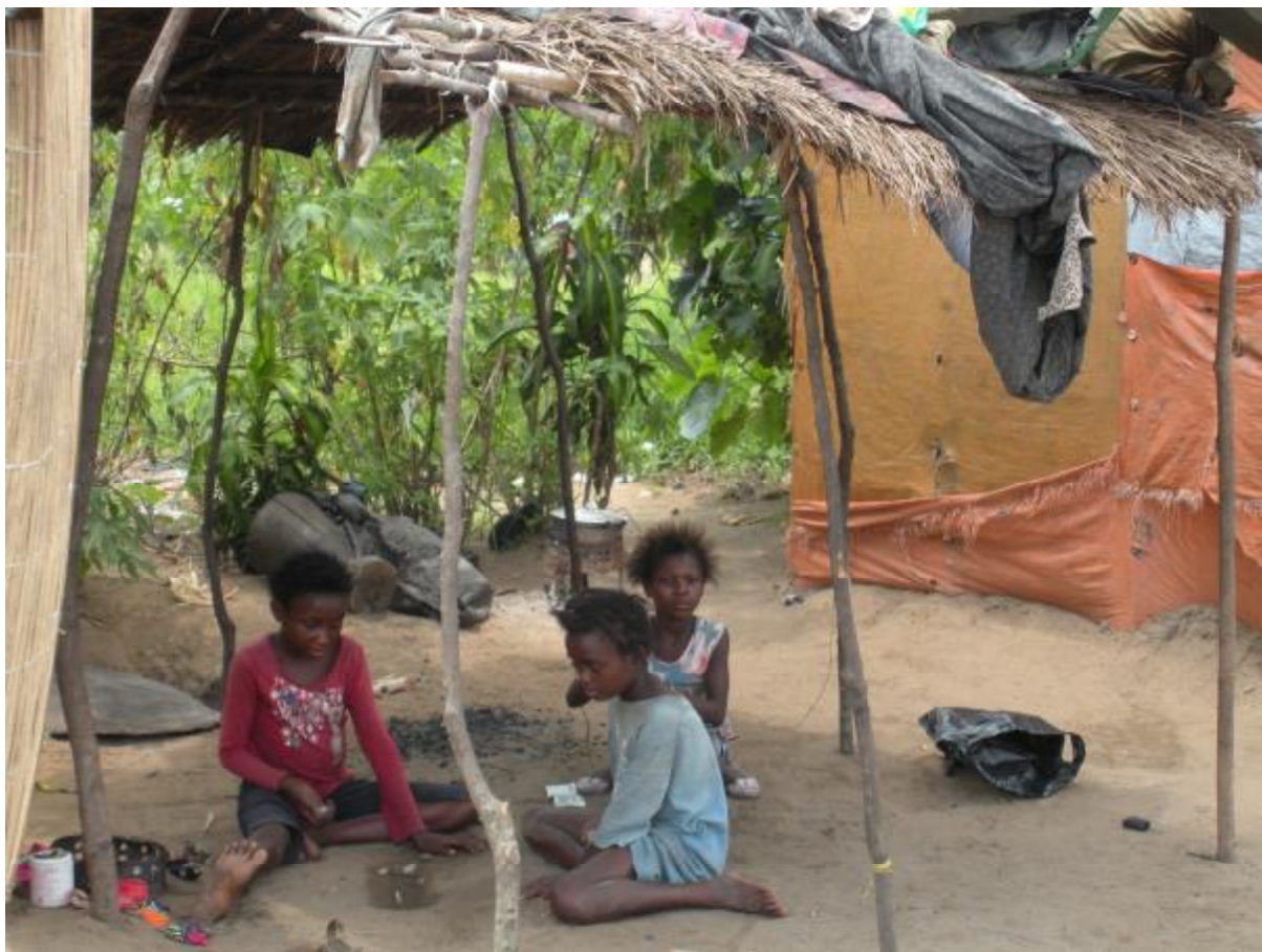
Les enfants jouant devant une propriété de la Cité de l'Espoir