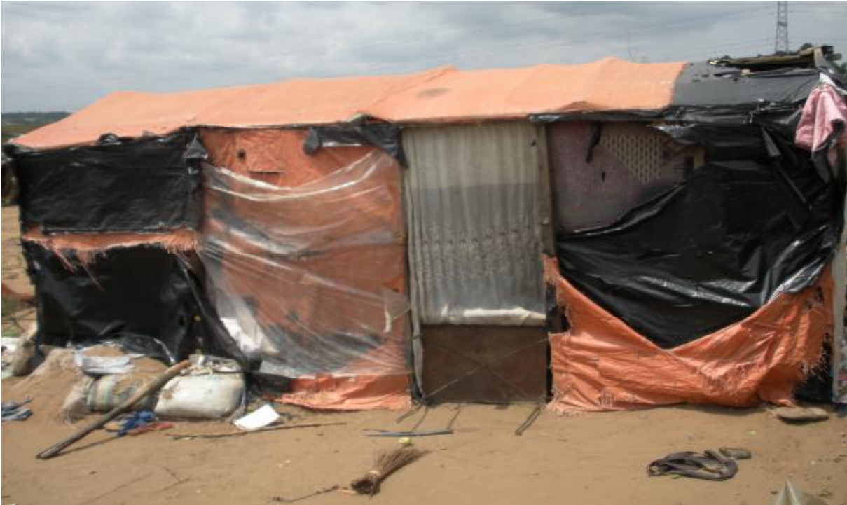
Une tente maison

L'article 48 de la Constitution du 18 février 2006 9 garantit le droit à un logement décent à chaque personne. Quant à l'article 11 du Pacte international relatif aux droits économiques, sociaux et culturels, il utilise le terme de « logement suffisant » à toute personne et à sa famille. De même, il est fait obligation aux Etats parties au Pacte de prendre des mesures appropriées pour assurer la réalisation de ce droit.