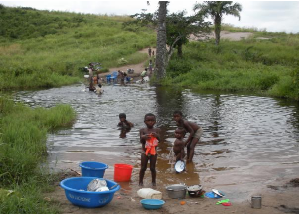
Rivière où les habitants s'approvisionnaient en eau avant l'installation des puits

Pour l'énergie électrique, la Cité de l'Espoir n'est pas alimentée en courant électrique bien qu'il soit un droit reconnu par la Constitution à tout citoyen congolais.